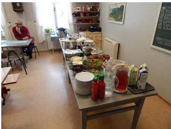
Ruuassa näkyi paikallisuus, ne maistuvaiset, paikan päällä tehdyt karjalanpiirakat