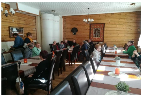
Mantan Majatalon juhlatila, vanhaa kauniisti korjattu