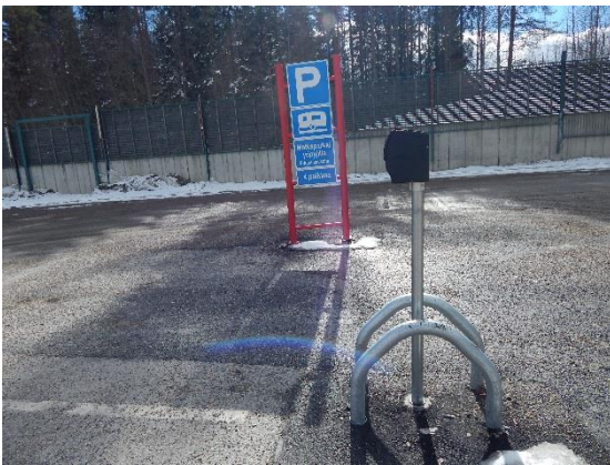
Matkailuparkin kyltti-idea bongattu matkalta.