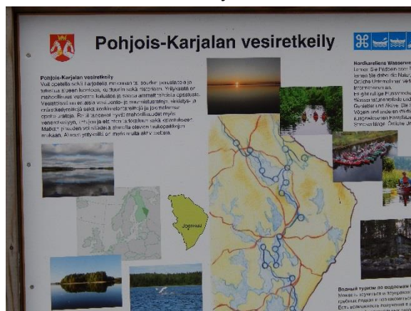
Infotaulu veneilyreiteistä, samanlaiset taulut tehdään Kuusaan kylän ulkoilureiteistä